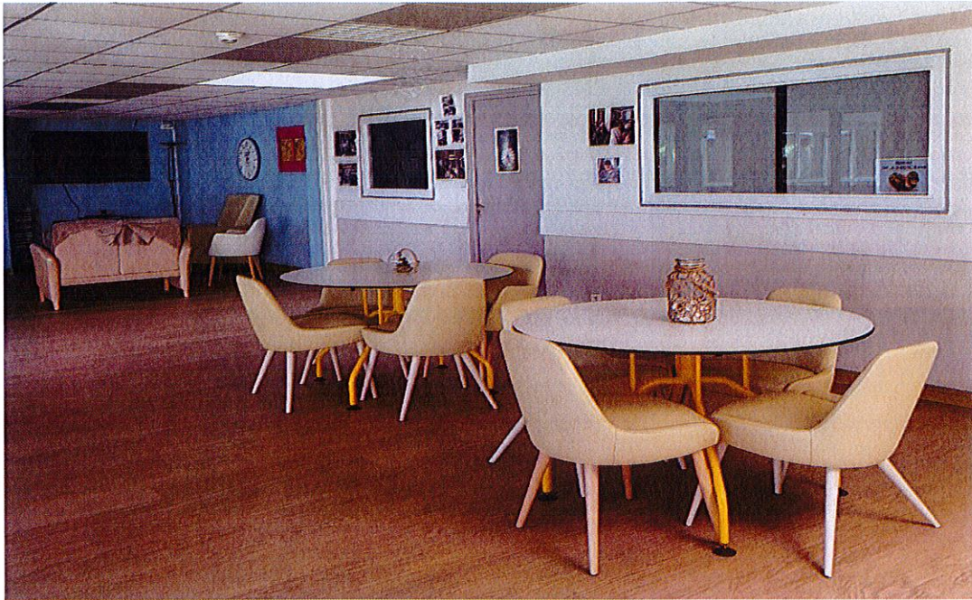
Le jardin d'hiver situé au rdc

Seules les personnes majeures et conscientes (ayant la capacité d'exprimer leur volonté de manière libre et éclairée) peuvent rédiger des directives anticipées. La rédaction de ces directives est présentée lors de l'entretien d'admission ou à tout moment de l'hospitalisation